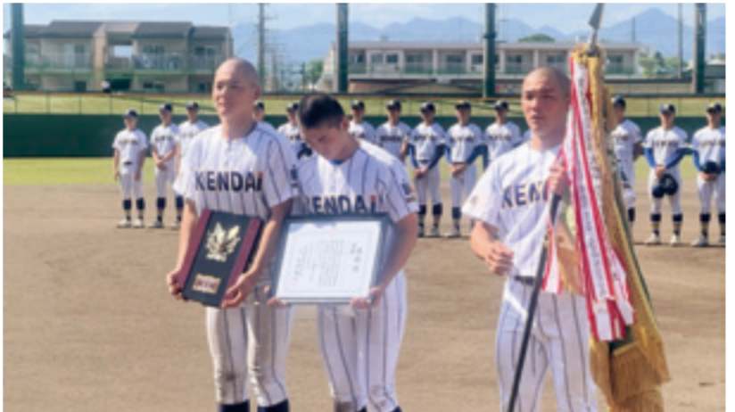
Youtuber撮影について教えてください。週に2本、長尺動画をあげていて、ショート

チームのうち7チームは2回戦からの登場となるため、夏の甲子園にむけた争いのなかで一歩優位になったといえる。夏の大会を勝ち抜くためには選手層の厚さも重要になってくる。この中でとくに甲子園春夏連覇をめざす健大高崎は春の選抜終了直後に連戦が続いていた。