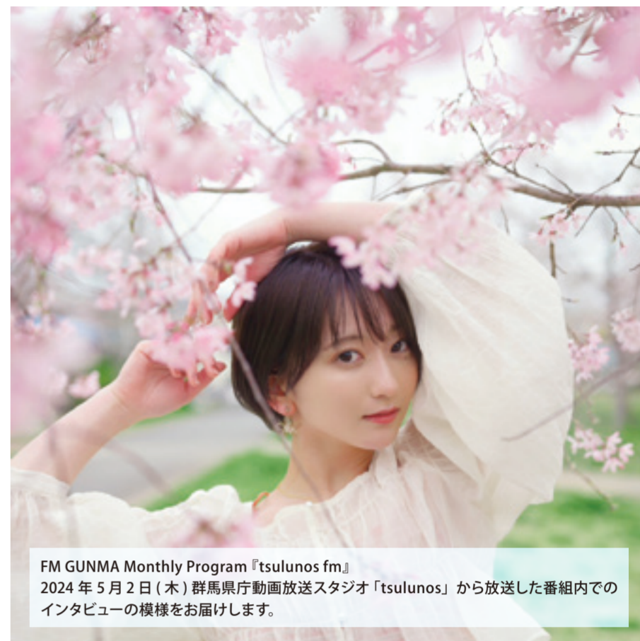
FM GUNMA Monthly Program 『tsulunofm』 2024年5月2日(木)群馬県庁動画放送スタジオ「tsulunofm」から放送した番組内でのインタビューの模様をお届けします。