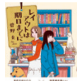
『レイアウトは期日までに』 碧野圭 出版元: U-NEXT

今回のブックジョッキーは、普段あまり本を読まない人や、ちょっと疲れている人でもスッと入っていきけると思うので、気軽に手に取ってみてください。