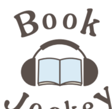
第49回 『レイアウトは期日までに』

読みながら「仕事」ってなんだ? 「良い仕事」とはどういうものか? という問いについて考えさせられる本でもあります。仕事のことで悩んでいる人、なかなかやる気が出ない人にもおすすみたいです。僕はこれを読んで仕事のやる気がぐぐりました。