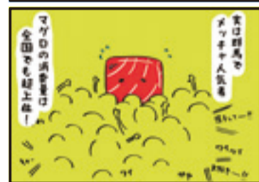
アンカンミンカン川島 X (旧ツイッター) フォロワー募集中! 「アンカンミンカン川島」で検索! @waaaaa_maanaa_ 気軽にフォローミー!