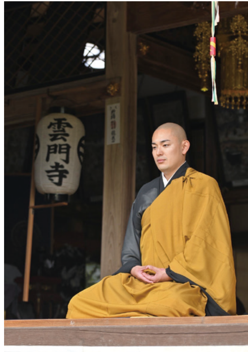
1月9日に放送された tsulunofm 出演時のインタビューを一部抜粋し、ご紹介！今を生きる人たちの支えになるようなお話を仏教の魅力とともにお話いただきました。

——活動の一環として制作し、話題となった『般若心経現代語訳ラップしてみた』のアイデアはどこから出たのですか？