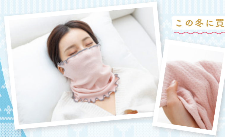
シルク保湿マスク 販売元 ミッシーリスト 詳しくはこちらから

この冬に買って良かったアイテムは「シルク保湿マスク」です。就寝中のおやすみマスクでシルクと綿の素材が柔らかく通気性もあるので、鼻と口を覆っても苦しくありません。耳にかけられるように穴が開いているので、ズレないもおススメです! 装着していると、子供が「お母さん怖いからやめて!」というので、息子が寝静まってからすっぽり隠して寝ています。