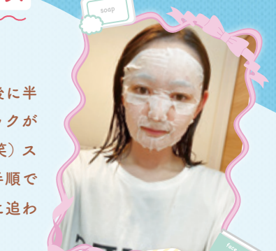
※掲載は本人の許可済みです。

意外と忘れがちなのが首で、最近はフェイスパックが終わった後に半分折ったパックで同じ時間首も保湿しています。最後にパックがバサバサになるまで腕や足にも残った液を塗たくっています(笑) スキンケアをするときに一番大切なのは気持ちです!! 同じ手順でも、「モチモチになれ〜」と思いながら丁寧に行った日と、時間に追われて急いでいた日では肌のうるおいが全然違うように感じます。