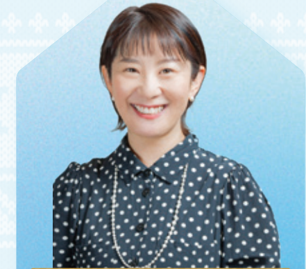
市川 まどか アナウンサー