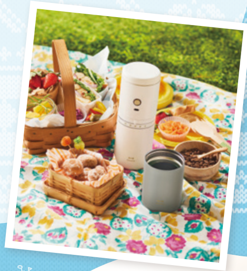
BRUNO パーソナル電動ミルコーヒーマーカー

電動ミル・ドリッパー・タンブラーが一体になっていて簡単にできますよ!あとは、ルームフレグランスの良い香りに包まれた部屋でぐっすり寝て、リラックスをしています! 日常のちょっとした特別時間が幸せだったりしますね^^