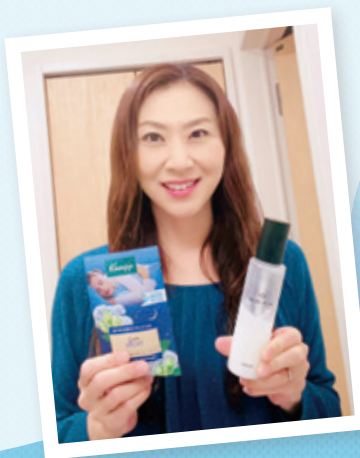
田中 香 アナウンサー